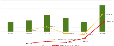
PRESUPUESTO EJERCIDO REAL, TASA DE CRECIMIENTO Y COMPORTAMIENTO DE LA META FÍSICA (BASE 2013=100)